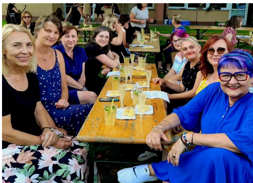
Zakončení školního roku 2023/2024 se všemi zaměstnanci na školní zahradě.